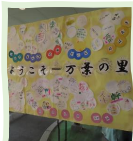
ウェルカムボード