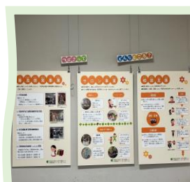
事業紹介のパネル