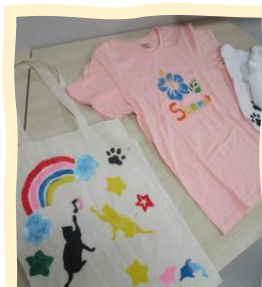
ステンシルの作品