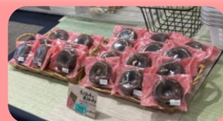
～～就労継続支援事業B型 どーむ スイーツ販売～～