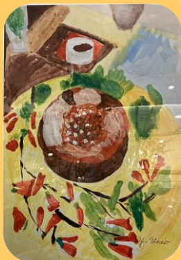
～～セレオ国分寺の展示作品～～