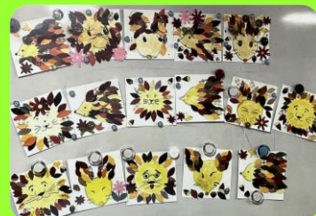
～～カレンダー掲載作品～～