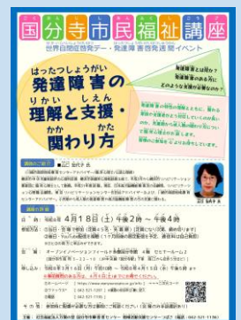
～市民福祉講座チラシ～