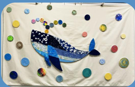
～パネル・クジラ展示～